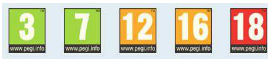
Imagen 1. Descriptores relativos a la edad recomendada.