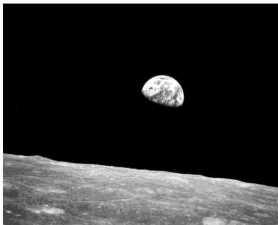
Figura 1. "Earthrise": la Tierra, nuestro hogar.

Un hecho que, a simple vista, pareciera ser algo aislado, pero que algunos historiadores marcan como algo que impulsó la conciencia acerca del cuidado de nuestro entorno, fue la imagen de nuestro planeta desde el espacio, la fotografía tomada por el astronauta William Anders en 1968. La tripulación del Apolo 8 dejó atrás la Tierra y voló alrededor de la Luna. Esta icónica fotografía se conoce como "Earthrise", y logró que la gente fuese consciente de lo bello y frágil que es nuestro planeta, siendo el único hogar del ser humano.