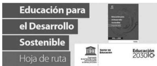
Figura 3. Hoja de ruta de la EDS.

Para traducir el marco EDS para 2030 en medidas concretas, la UNESCO (2020) ha diseñado una hoja de ruta en la que se identifican las áreas específicas de trabajo y las medidas de intervención que deben poner en marcha los Estados Miembros, así como las organizaciones de la sociedad civil. El sistema educativo de cada país debe potenciar los cambios necesarios para encontrar el rumbo adecuado a un mundo justo y sostenible, nuestro futuro depende de cómo actuemos en el presente.