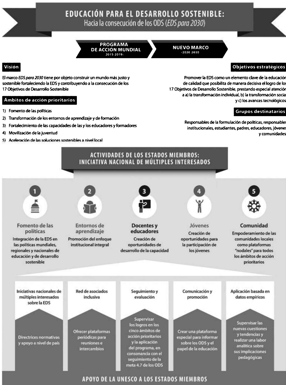
Figura 6. Marco EDS para 2030 UNESCO (2020)